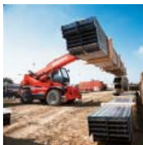
Movimentazione in cortile, (leggero e pesante)