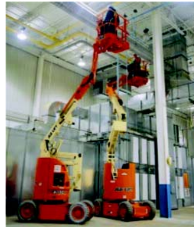
Idraulici e lattonieri