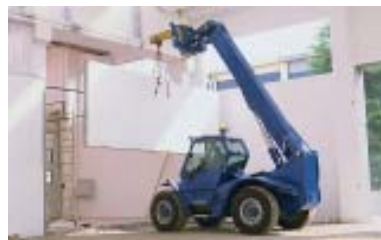
Lavorazione marmo ed affini