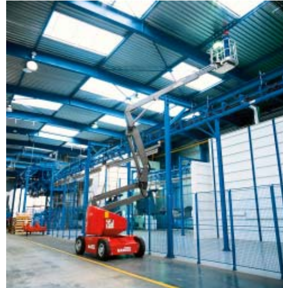
Termotecnica e riscaldamento, apparecchiature e servizi