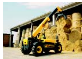
Agricoltura, orticoltura e floricoltura