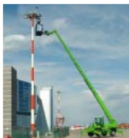
Enti pubblici e comunità