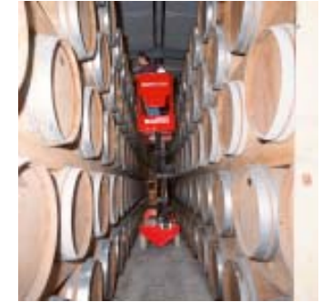
movimentazione dei prodotti aziendali