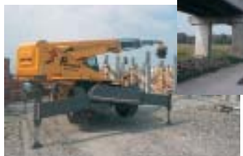
Imprese edili, Scavi e demolizioni, Costruzione e manutenzione strade