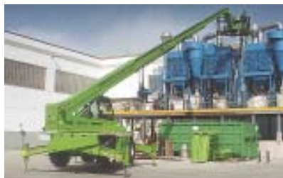
Impianti idraulici e termoidraulici