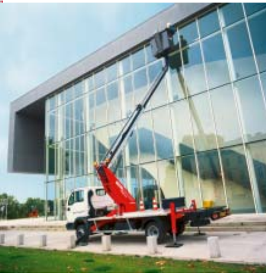
Serramenti ed infissi