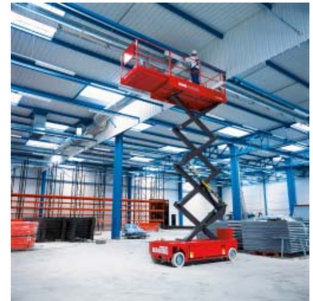
Climatizzazione e condizionamento, apparecchiature e servizi. Impianti di condizionamento aria