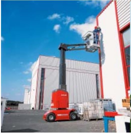
Impianti elettrici industriali