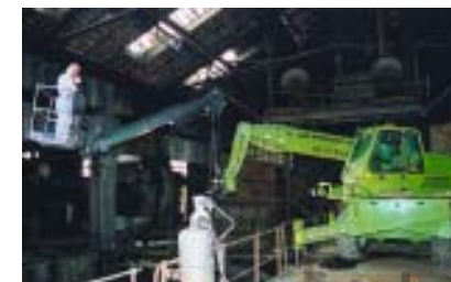
Ecologia e smaltimento rifiuti amianto